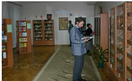
Виставкова зала (2009 р.)