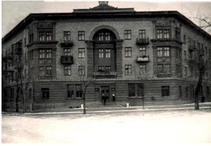
Приміщення бібліотеки з 1954 по 1977 рр.

бібліотеки, великий вестибюль із роздягальнями. Будівництво розпочалося в 1951 р., а у вересні 1952 р. вже відбувався переїзд бібліотеки до нового приміщення.