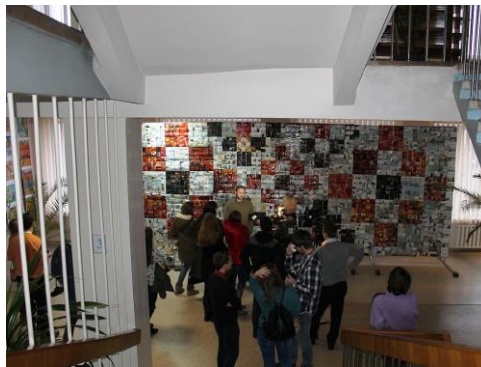
Хол бібліотеки (2013 р.)