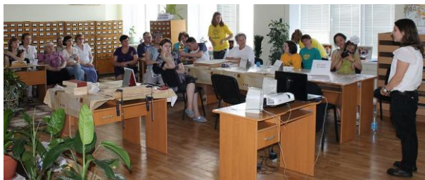
Бібліотечний простір (2013 р.)