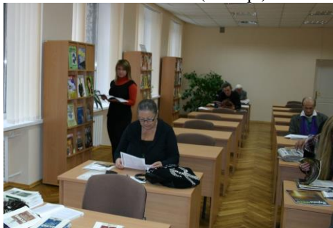
Читальна зала (2012 р.)