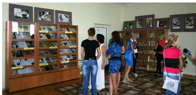
Відділ мистецтва (2012 р.)