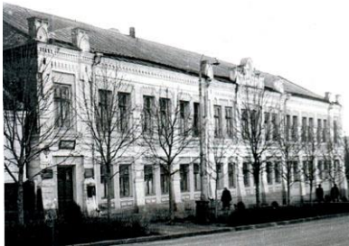
Довоєнне приміщення бібліотеки.

Не маючи окремого приміщення, бібліотека спочатку функціонувала у відведеному для неї кутку зали засідань міської Думи, згодом, у 1909 р., зайняла дві кімнати будинку на вул. Покровській. У 1920 р. її спадкоємницею стала Центральна міська робітнича бібліотека. У першій половині 30-х рр. Центральна міська робітнича бібліотека одержала частину двоповерхового приміщення на вул. Чекістів, 30.