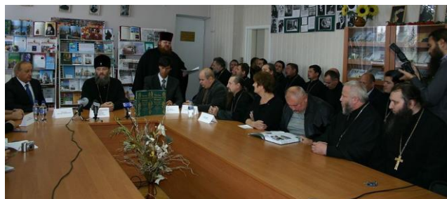
Конференц-зала (2012 р.)