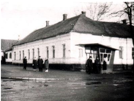
Приміщення бібліотеки імені О.М. Горького в 1944-1952 рр.

У воєнні роки (1941–1943 рр.) фонд було втрачено і лише у квітні 1944 р. рішенням обласного виконкому за бібліотекою закріплюють приміщення на вул. Лепіка, 12, з двох невеличких квартир.