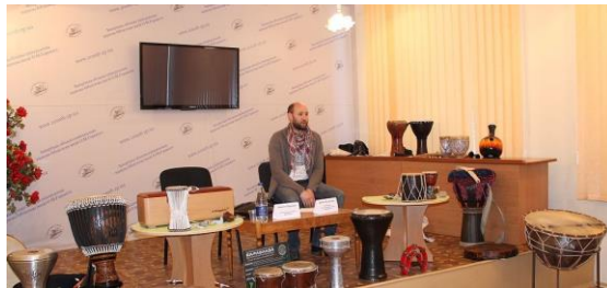
Лекційна зала (2013 р.)