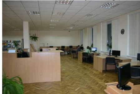
Зала електронних ресурсів (2012 р.)